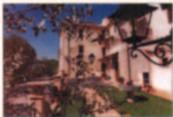
Agriturismo Santo Pietro Fara in Sabina

C'è chi vive circondato da cose belle. C'è chi, come noi, fa cose belle per poterci vivere accanto. Colorare il nostro paese, arricchirlo con favole fantastiche, trasformare tristi e grigi muri in pagine da leggere ed osservare. E' questo, ciò che noi ragazzi dell'Associazione Culturale Giovanile 360° Configni ci siamo proposti di fare. Mettere in movimento la fantasia dei bambini per migliorare il nostro paese. E' l'obiettivo fondamentale della nostra avventura, tesa a rendere Configni il paese delle favole. Il 3 Giugno è una giornata dedicata interamente ai bambini e a chi ha voglia di sentirsi ancora tale. Gioia, risa, serenità, felicità, spensieratezza, tanti colori e allegria da vendere, ecco il tema della giornata. Il tutto, sarà accompagnato da stand gastronomici, banda musicale e spettacoli d'animazione, con truccabimbi, palloncini colorati e trampolieri. La festa terminerà con la premiazione del lavoro più bello, che sarà esposto permanentemente per le vie del centro. Tutti gli elaborati creati saranno visibili sia durante la manifestazione, sia durante la festa “Cantincantina” (dal 16 al 21 agosto). Ricordandovi che i bambini sono la fonte, cui attingere per poter migliorare la nostra vita e che potenziare le loro capacità permette di avere a disposizione un mondo migliore, v'invitiamo a portare a Configni un po' della vostra allegria e gioia di vivere. La presenza dei tanti vostri sorrisi faranno la fortuna della nostra festa!