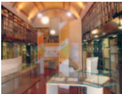
La biblioteca dell'Abbazia di Farfa

• A Stimigliano, dalle ore 16 e 30, in Piazza "Leone Orsini", si tiene l'ottava edizione del Concorso di poesia "S. Bernardino". La manifestazione, raccoglie partecipanti da tutta la regione ed è arricchita dalla presenza di scolaresche. Il Premio di poesia, prevede la partecipazione di personalità impegnate nel mondo della cultura.