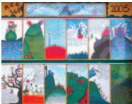
Dipinto realizzato dai bambini dell'associazione 360°