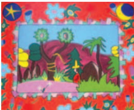
Dipinto realizzato dai bambini dell'associazione 360°

• A Poggio Moiano, alle ore 10 e 30, spettacolo "Nascita di Roma" drammaturgia e regia di Sista Bramini, "O Thiasos" Teatro Natura. Ingresso 1 euro.